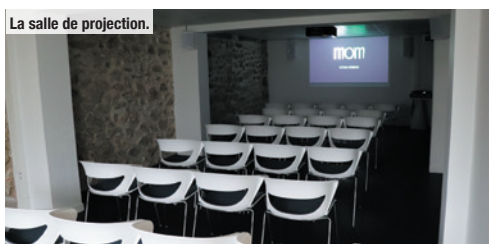
La salle de projection.