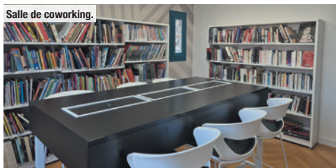
Salle de coworking.